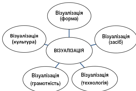
Рис. 2. Ментальна карта до поняття «візуалізація»

На думку Г. Ільїної, сучасній людині потрібна «візуальна розумність» (visual intelligence), яка є якістю розуму, що не тільки включає навички використання візуальної комунікації, але також містить цілісне поєднання вербального і візуального аргументування: від розуміння смислових елементів до зображення, що можуть змінюватися і ведуть до спотворення реальності, до використання візуального в абстрактному мисленні» (Ільїна, 2018: 165).