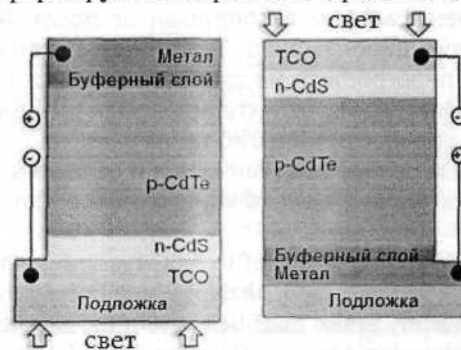
Рисунок 2 – Схематическое изображение поперечного сечения тонкопленочного СЭ на основе гетеросистемы CdS/CdTe в «тыльной» (слева) и «фронтальной» (справа) конфигурациях

На сегодняшний день наибольшее значение напряжения холостого хода для СЭ на основе CdS/CdTe составляет около 1,0 В [5]. СЭ на основе гетеросистемы CdS/CdTe бывают двух конфигураций: «тыльной» и «фронтальной». На рис. 2 представлено схематическое изображение поперечного сечения тонкопленочного СЭ на основе гетеросистемы CdS/CdTe в этих конфигурациях. При «тыльной» конфигурации сперва формируется контакт прозрачного проводящего оксида (transparent conducting oxide или TCO) и заканчивается непрозрачным металлическим контактом. При «фронтальной» конфигурации слои формируются обратным чередованием.