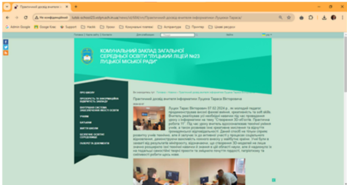
Рис. 1. Фрагмент новин на сайті Луцького ліцею № 23 заходу відкритого заняття Т. Луцюка

високі результати роботи під час відкритого заняття. 07.02.2024 р. захід було проведено в 9-В класі комунального закладу загальної середньої освіти Луцький ліцей № 23 Луцької міської ради ( http://surl.li/urohg ). В процесі роботи було залучено 13 учнів (рис. 1).