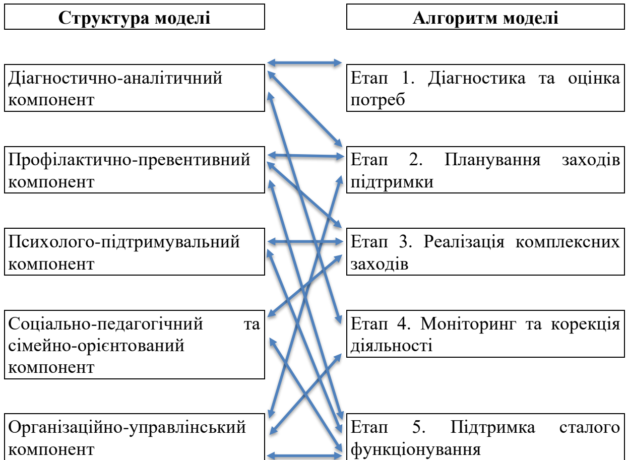
Рис. 2.2.1 Структура моделі соціально-педагогічної підтримки безпечного освітнього середовища

Перший етап моделі – діагностика та оцінка потреб – є фундаментом для подальшого планування, реалізації та оцінювання заходів соціально-педагогічної підтримки. Його ключова мета полягає у всебічному виявленні потреб, ризиків і ресурсів, що визначають безпеку та психологічне благополуччя учасників освітнього процесу. Саме на цьому етапі формується початкове розуміння ситуації, яке дозволяє вибудувати індивідуально орієнтовану й ефективну систему підтримки.