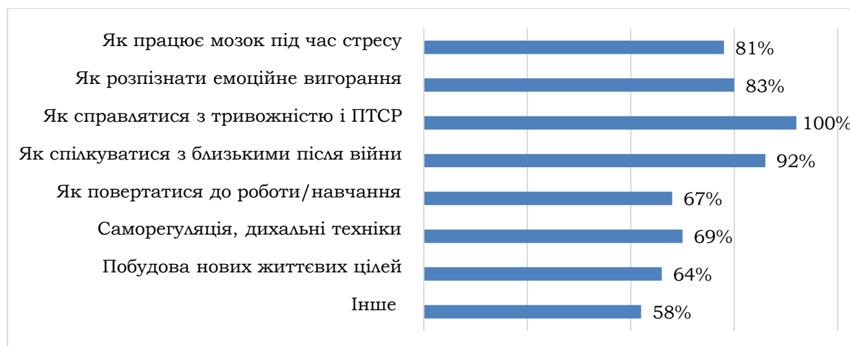
Рис. 2. Теми психоедукаційних програми у яких зацікавлені військові.

Серед тем, з якими демобілізовані військові хотіли б ознайомитись у межах психоедукаційної програми визначено наступні: як працює мозок під час стресу, як розпізнати емоційне вигорання, як справлятися з тривожністю і ПТСР, як спілкуватися з близькими після війни, як повертатися до роботи/навчання, саморегуляція, дихальні техніки, побудова нових життєвих цілей (рис. 2).