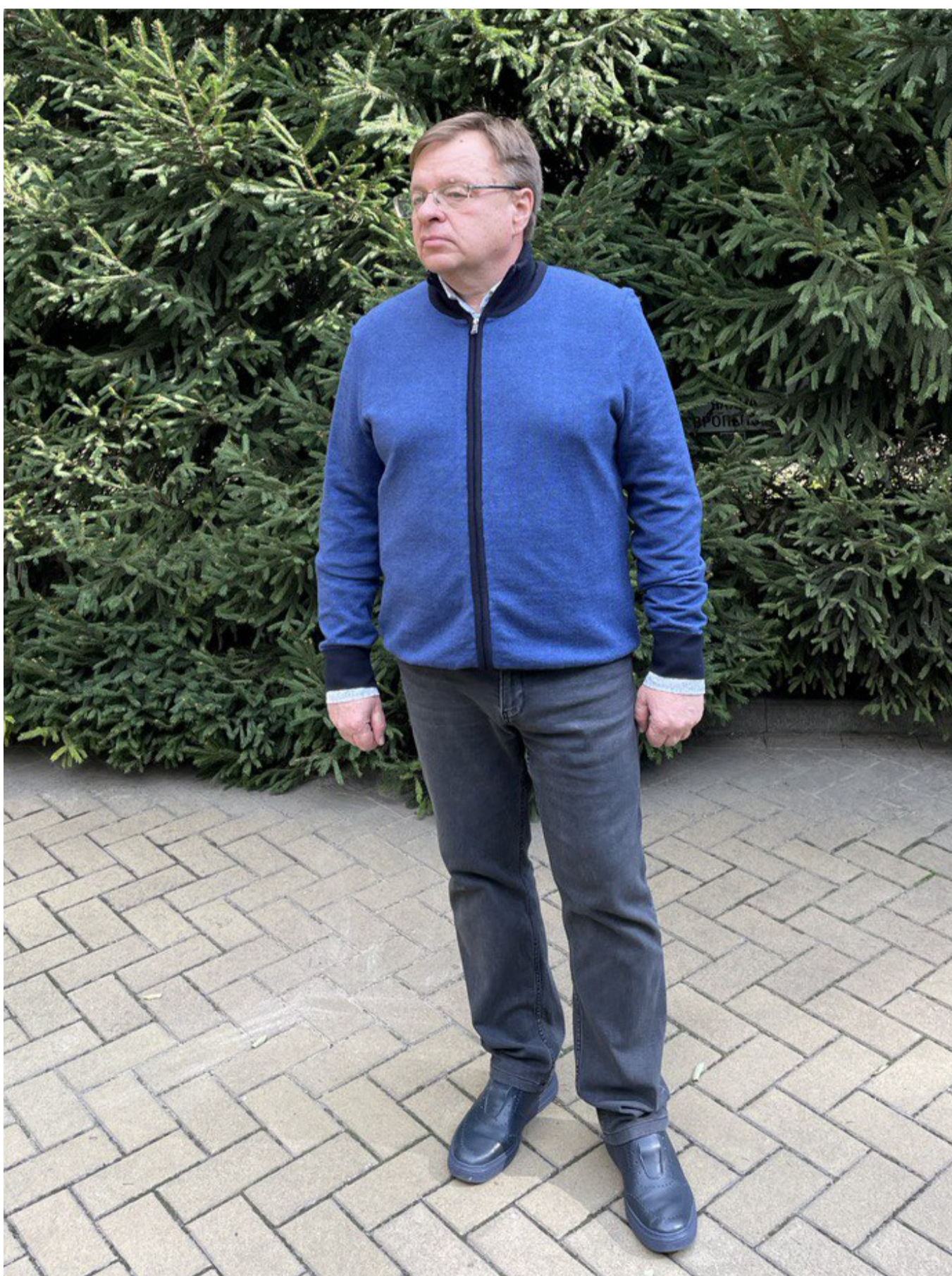
Ректор Ігор Богданов

Червень – місяць, коли закінчуємо навчальний рік, виставляємо семестрові оцінки, формуємо рейтинги успішності, проводимо випускні вечори, готуємо документи про освіту до вручення. Водночас червень – це місяць, коли максимально активізуємо профорієнтаційну роботу. Так наш університет взяв участь у масштабному освітньому івенті Dnipro Education City 2023, де на одній локації зібралося понад 45 закладів передвищої, вищої та професійної освіти міста Дніпра. На базі бердянського хабу «Бердянськ – свій для своїх» організували День відкритих дверей у змішаному форматі, де було понад 200 зацікавлених осіб. Провели чергові традиційні зустрічі з колективами факультетів та персоналу, які вкотре продемонстрували єдність нашої університетської освітянської родини, її згуртованість і націленість на подальшу роботу. Продовжуємо поширювати позитивний імідж університету, підтримуємо зв'язки з друзями і партнерами. Бо лише завдяки спільним зусиллям і злагодженій роботі нашого колективу ми здатні подолати всі виклики сьогодення. А завдяки Силам Оборони продовжуємо працювати і наближувати нашу Перемогу!