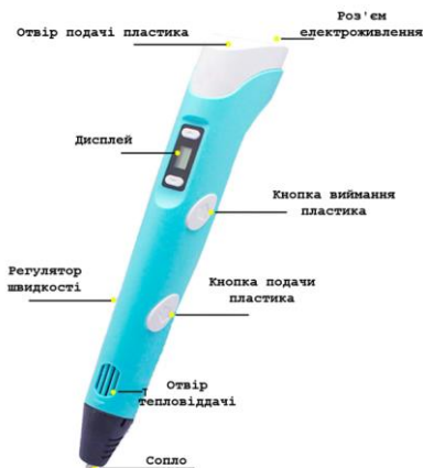
Рис. 1 Зовнішній вигляд 3D-ручки

треба обмотати скотчем. Кожен малюнок необхідно створювати із частин, щоб можна було потім зняти з шаблону-основи, а вже потім все з'єднати.