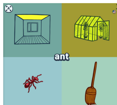
Рис. 3. Робота з програмою Ba Ba Dum

Інший цікавий ресурс – Babadum (рис. 3), який пропонує ігрові заняття для вивчення слів на різних мовах. На цьому сайті здобувачі освіти можуть обирати слова з різних категорій і виконувати завдання, пов'язані з поповненням словникового запасу. Багато здобувачів освіти відзначають, що ігровий формат допомагає їм легше запам'ятовувати нові слова та поліпшувати вимову. Babadum дає можливість перетворити вивчення великої кількості слів на захопливий процес, що особливо важливо в процесі вивчення іноземної мови.