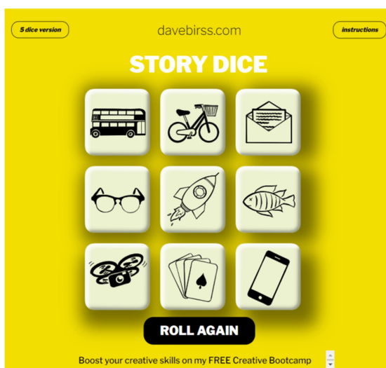
Рис. 1. Story Dice

Один із інтерактивних та корисних інструментів – Story Dice (рис. 1). Цей сайт дозволяє студентам генерувати випадкові ідеї для оповідань, натискаючи на кубики із зображеннями. Кожен кубик містить ілюстрації, які можуть бути використані як натхнення для створення власних історій. Цей інструмент не лише сприяє розвитку творчих навичок, але й стимулює студента до цікавої розмови, що є важливим компонентом вивчення мови. Студенти із задоволенням беруть участь у таких ігрових активностях, і це значно підвищує їхню мотивацію [19].