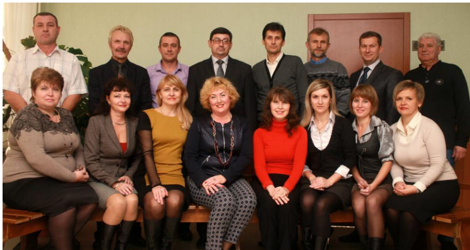
З повагою, колектив кафедри теорії та методики технологічної та професійної освіти

А Ваше земне життя повниться науковими здобутками, щирими взаєминами у родині, радісними несподіванками у особистому житті та міцним здоров'ям.