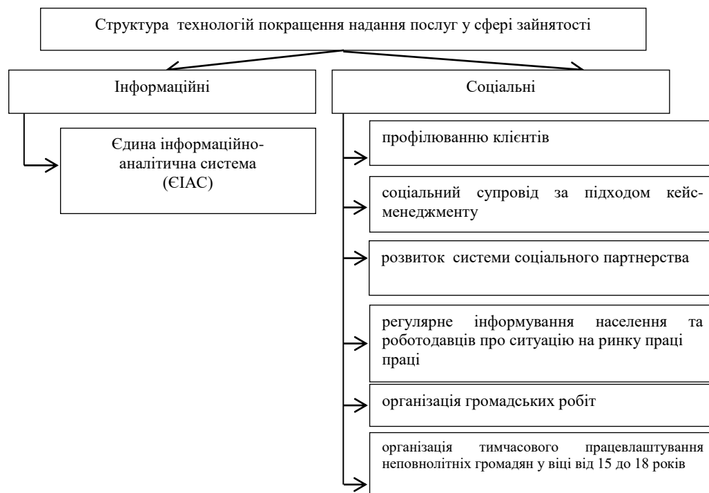
Рис. 1: Види технологій покращення надання послуг у сфері зайнятості

Для покращення надання соціальних послуг у сфері зайнятості створено інноваційну модель на основі Єдиної технології та Єдиної інформаційно-аналітичної системи (ЄІАС). Ці технології визнані винаходами і мають авторські свідоцтва та патенти.