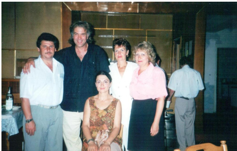
З Анатолієм Хостикоевим та Наталією Сумською