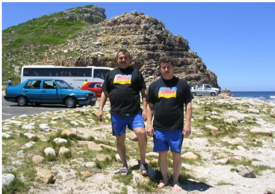
Мис Доброї Надії, Південна Африка (2004 рік)