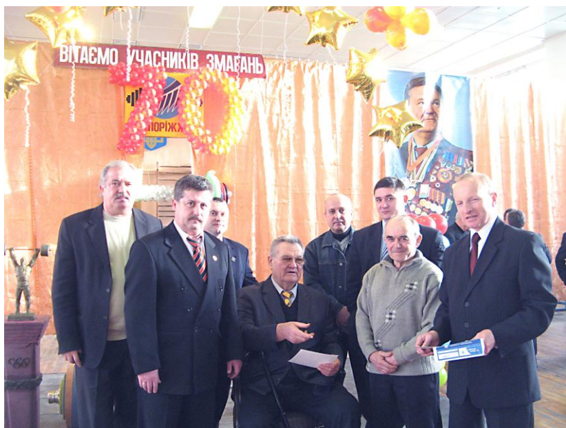
З Леонідом Жаботинським. Колеги по спорту