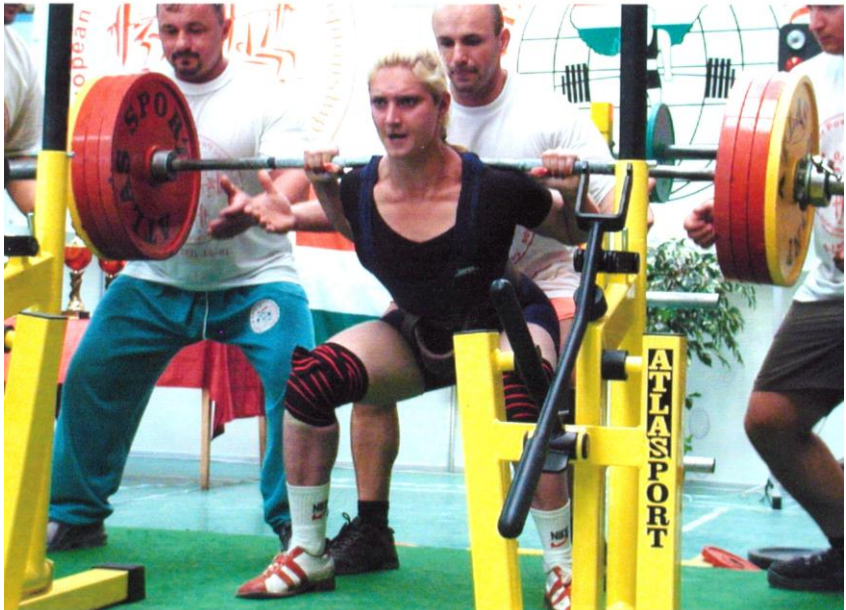
Чемпіон світу Яна Петренко