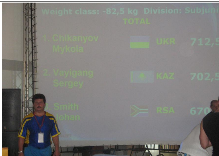
Чемпіонат світу. Франція (2007 рік)