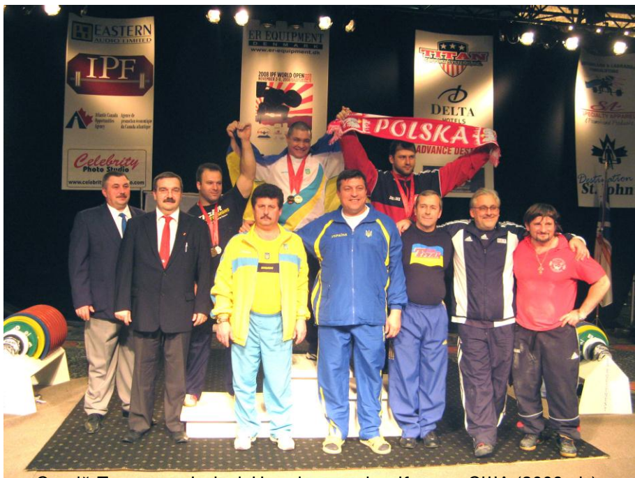
Сергій Певнев на I місці. Чемпіонат світу. Канада-США (2008 рік)