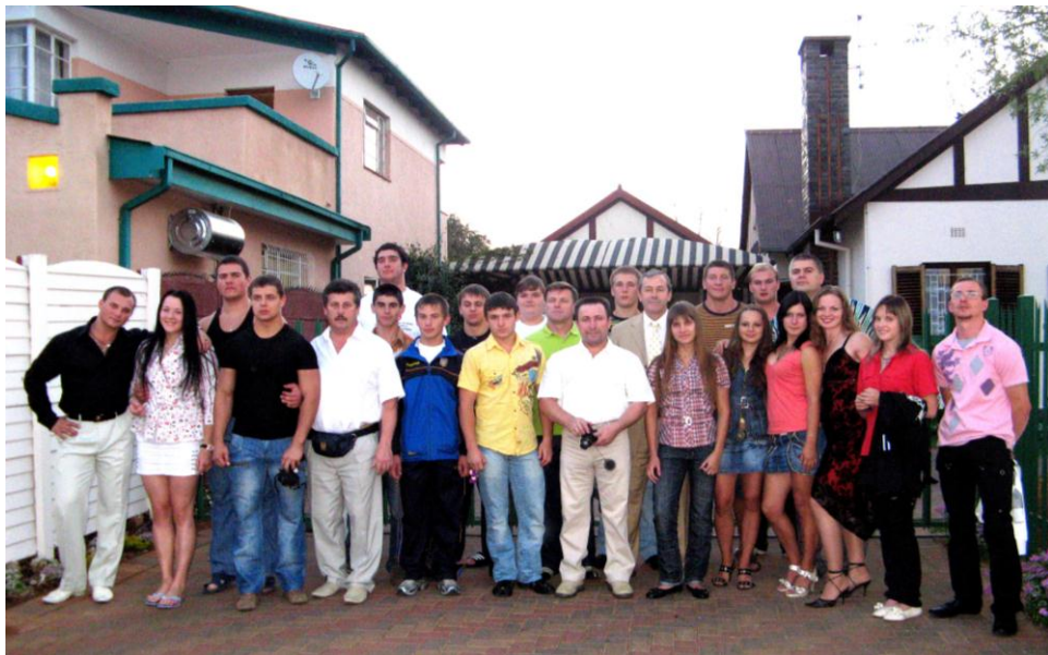
Збірна України на Чемпіонаті світу. Африка (2008 рік)