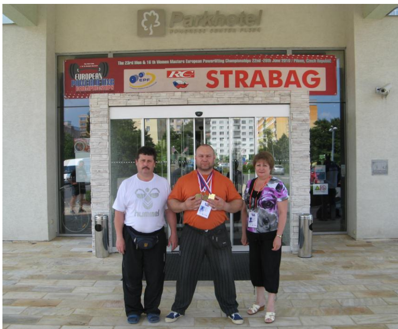
Чемпіонат Європи. Пльзень, Чехія (2010 рік)