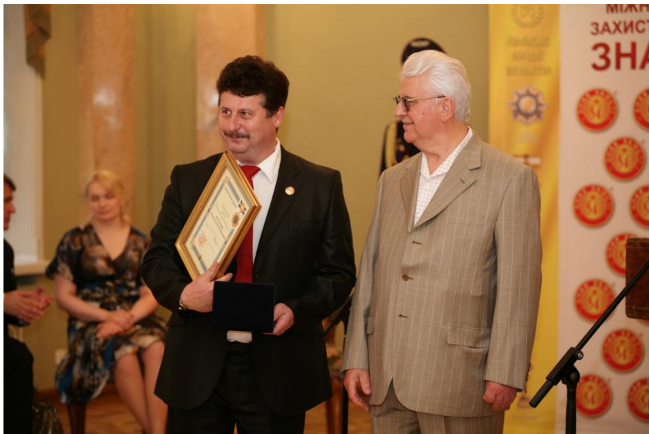
Вручення Ордену Народного посольства