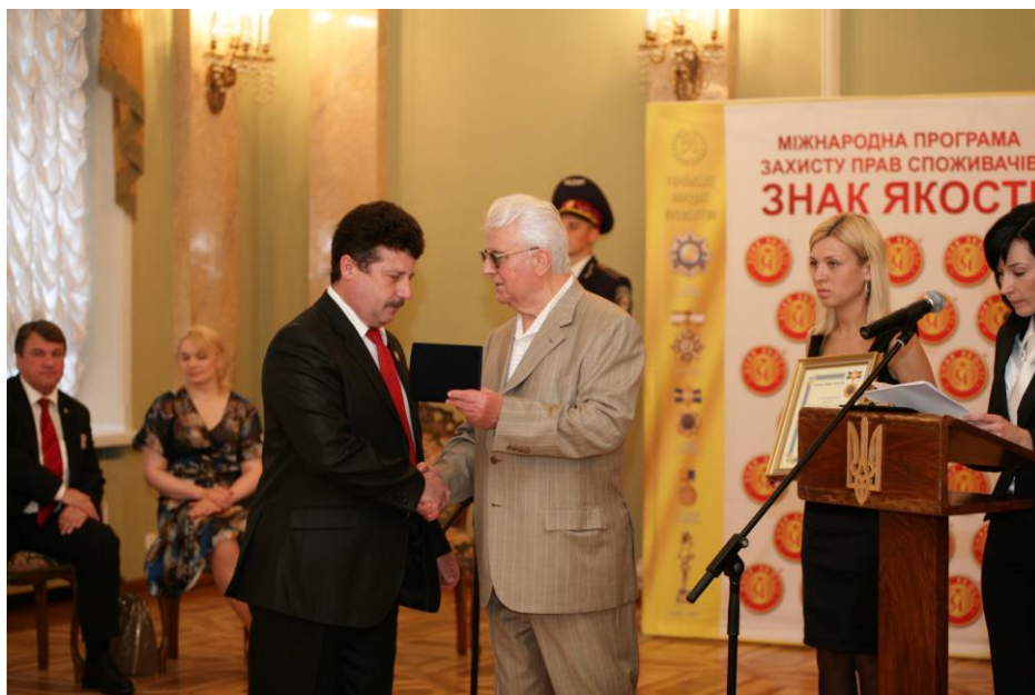
Вручення Ордену Народного посольства