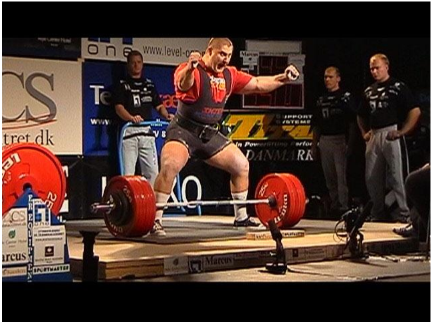
Чемпіон світу Віктор Карпик