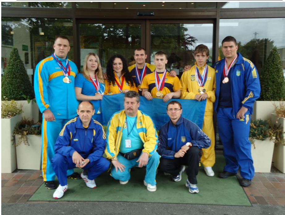
Чемпіонат Європи. Англія (2009 рік)