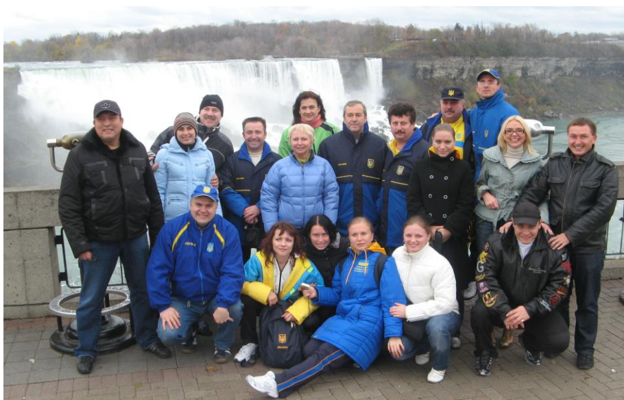
Збірна України. Ніагарський водоспад (2008 рік)