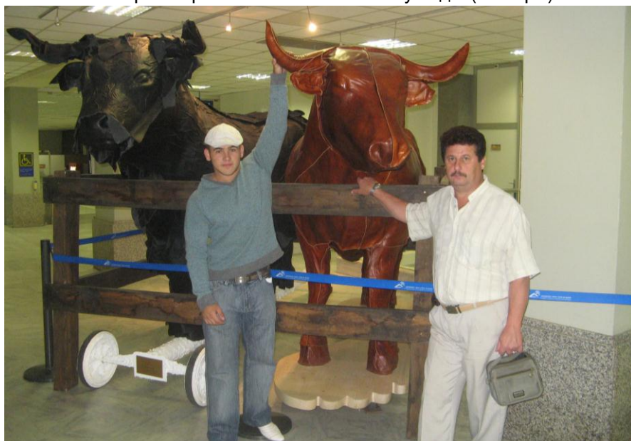
Чемпіон світу Чиканьов Микола (Франція, 2007 рік)