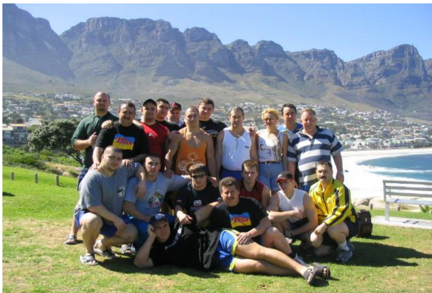
Збірна України в Кейптауні (2004 рік)