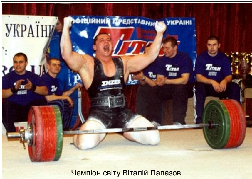
Чемпіон світу Віталій Папазов