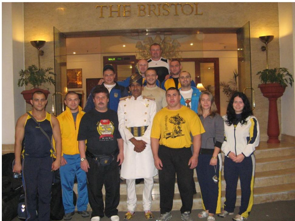
Збірна України на Чемпіонаті світу. Індія (2009 рік)