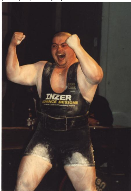
Чемпіон світу Євген Яримбаш