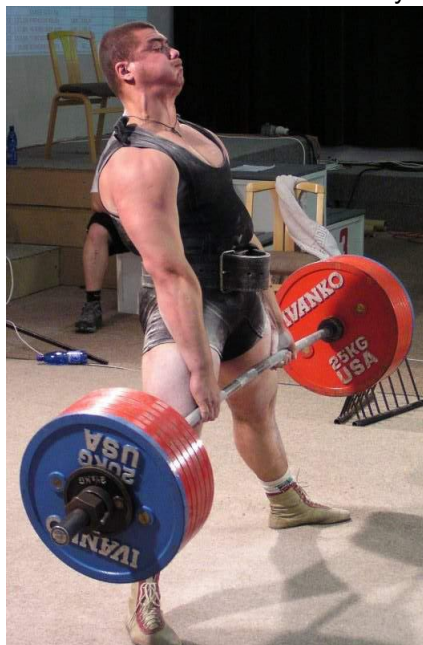
Чемпіон світу Роман Ворошилін