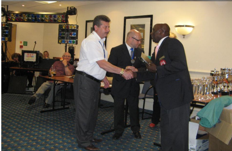
Нагорода 3 рук Генерального секретаря IPF