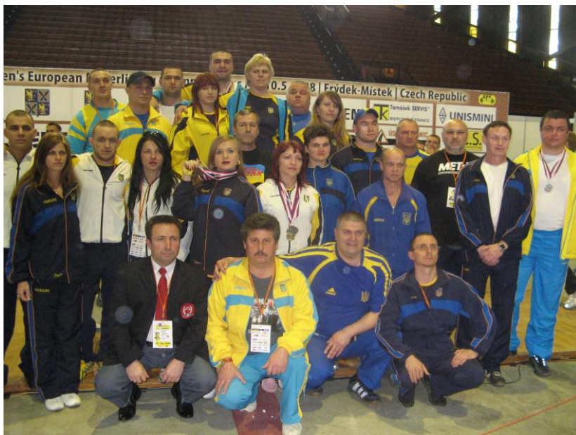
Чемпіонат Європи. Чехія (2008 рік)